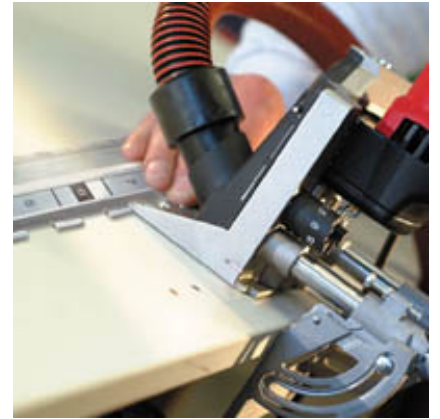
Rapide et favorable : fabrication de corps de meubles avec DD40 et gabarit pour mèche à tourillons.